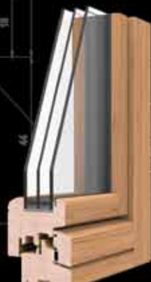
telaio 80 anta 90