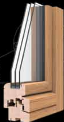
telaio 80 anta 80