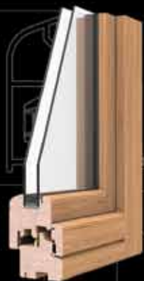
telaio 68 anta 68