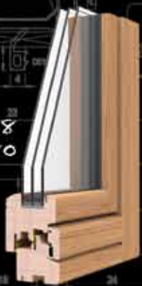
telaio 68 anta 80